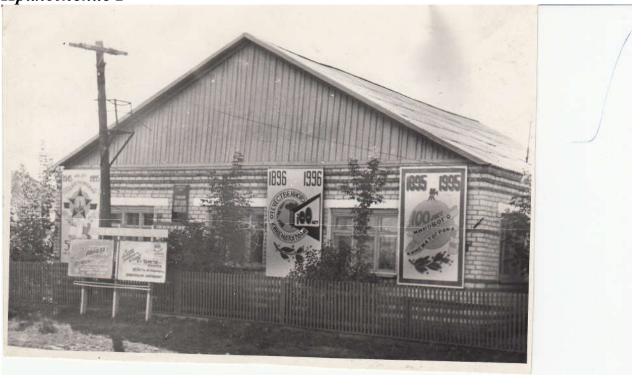
Здание Сорокинской киносети.